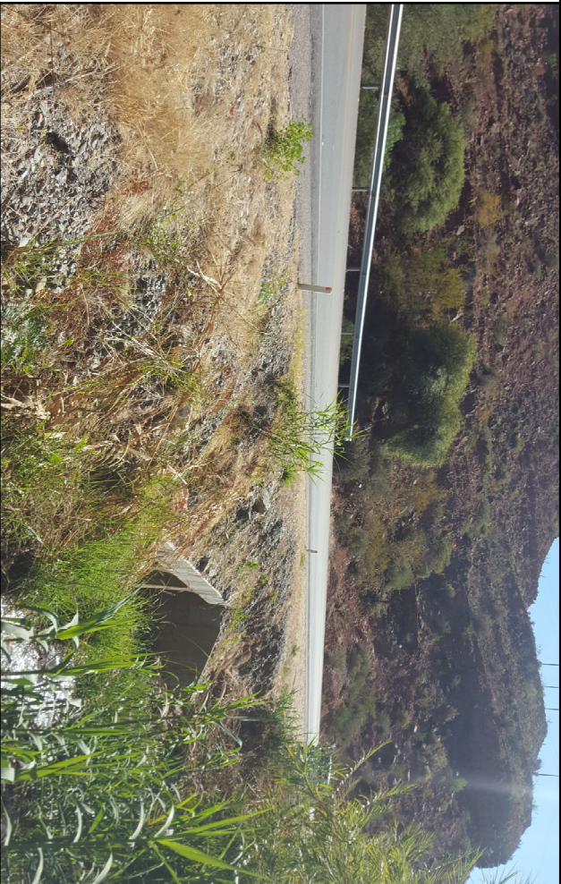
VISTA SUPERIOR - CRUCE DE ALCANTARILLA CON FUNDA METÁLICA Y DADOS DE HORMIGÓN